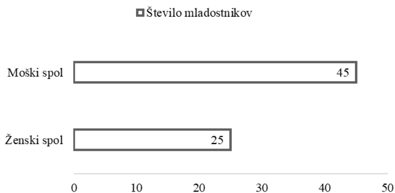
Slika 1. Sestava vzorca glede na spol

V Mladinskem domu Maribor je bilo v času raziskave nameščenih 82 mladostnikov, na anketi vprašalnik pa jih je odgovarjalo 70. Od tega je bilo 45 mladostnikov ali 64 % in 25 mladostnic ali 36 % od celotne populacije (Slika 1).